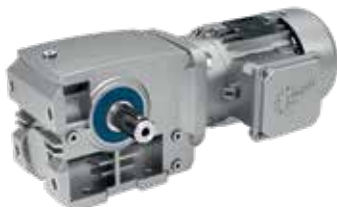
B14-Flansch, Vollwelle, Motor integriert