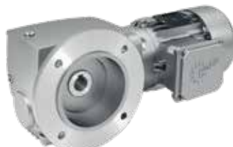
B5-Flansch, Hohlwelle, Motor integriert