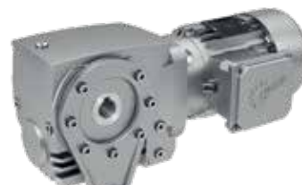
B14-Flansch, Drehmomenten- stütze, Hohlwelle, Motor integriert