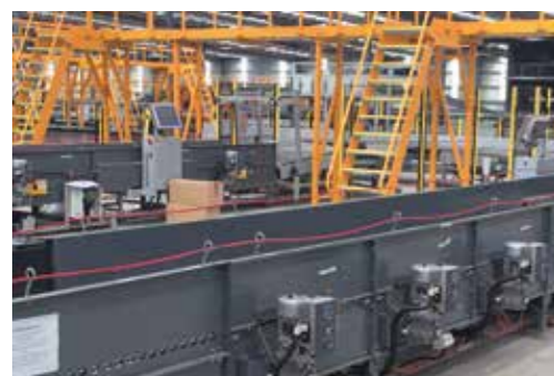
Solución BCS para la instalación de Toll IPEC en Melbourne