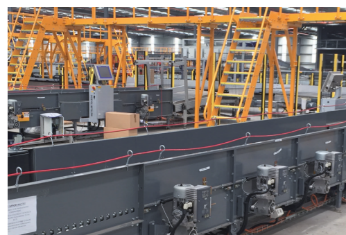
BCS-Lösung für die Toll IPEC-Anlage in Melbourne